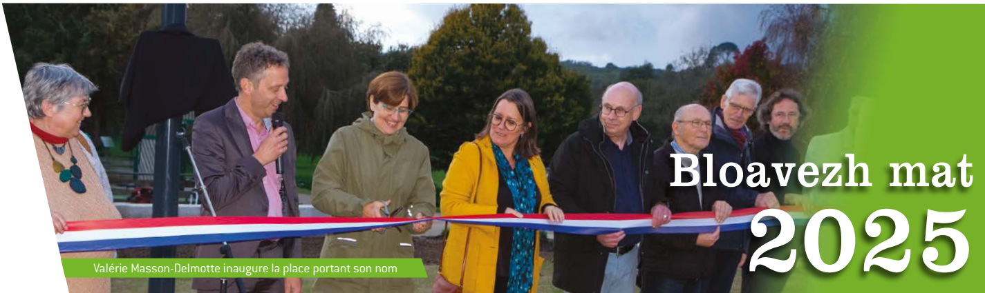
Valérie Masson-Delmotte inaugure la place portant son nom

lettre d'information municipale de Saint-Quay-Perros