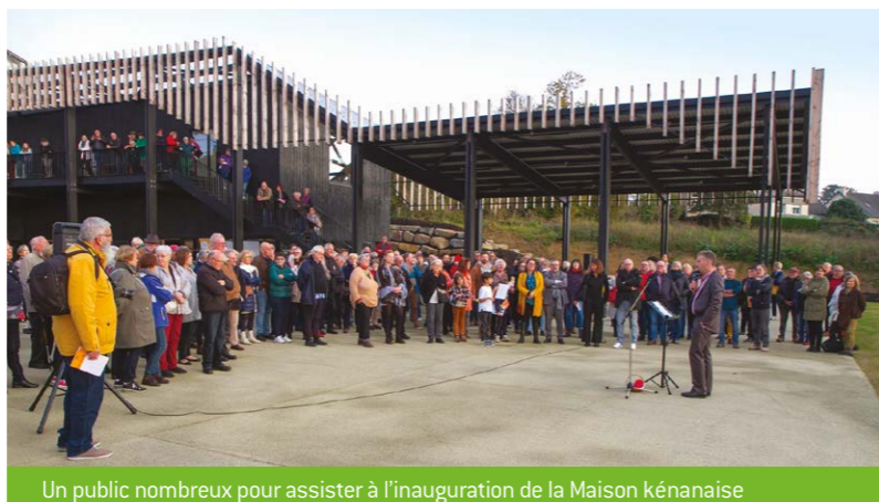
Un public nombreux pour assister à l'inauguration de la Maison kénanaïse