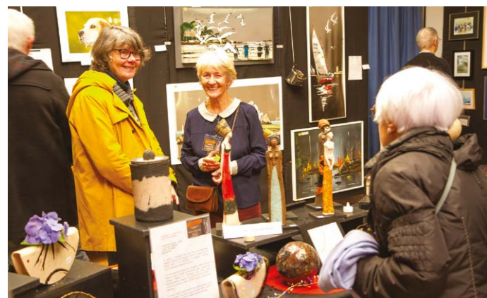
Ambiance chaleureuse des allées de l'exposition

Au programme, mosaïque sur poisson bois, création et bijoux en papier, raku céramique. Sur les grilles installées par les services techniques, que nous remercions vivement, de nombreux pastels, photographies et peintures acryliques de toutes tailles avec là un paysage japonais, un bord de mer, des bateaux sur plaque acier