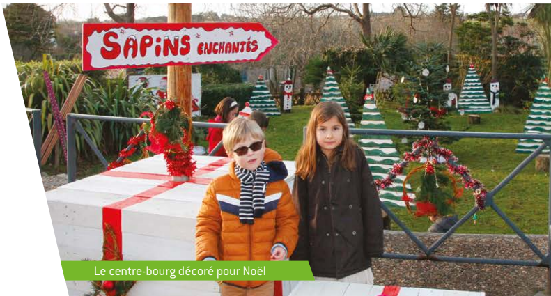
Le centre-bourg décoré pour Noël

lettre d'information municipale de Saint-Quay-Perros