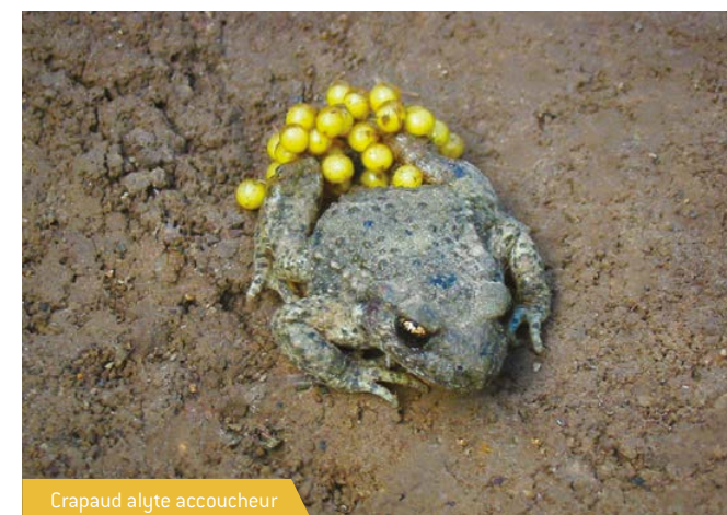
Crapaud alyte accoucheur

photographie et de la vidéo. «Une fois qu'on a commencé, on va jusqu'au bout» ; il ne compte pas son temps dans l'apprentissage des logiciels d'animation et dans la recherche documentaire. Il participe à des expositions locales, régionales et même nationales. À sa retraite, au début des années 2000, il a pris «un temps fou» pour observer les libellules de leur jardin. Résultat : en 2004, il réalise un petit film sur la naissance d'une libellule [*] avec de superbes images. Grâce à une culture de plants de fenouil dans le jardin, il a vécu une expérience peu commune : il a photographié le développement du machaon à tous ses stades jusqu'à l'envol du papillon de sa main !