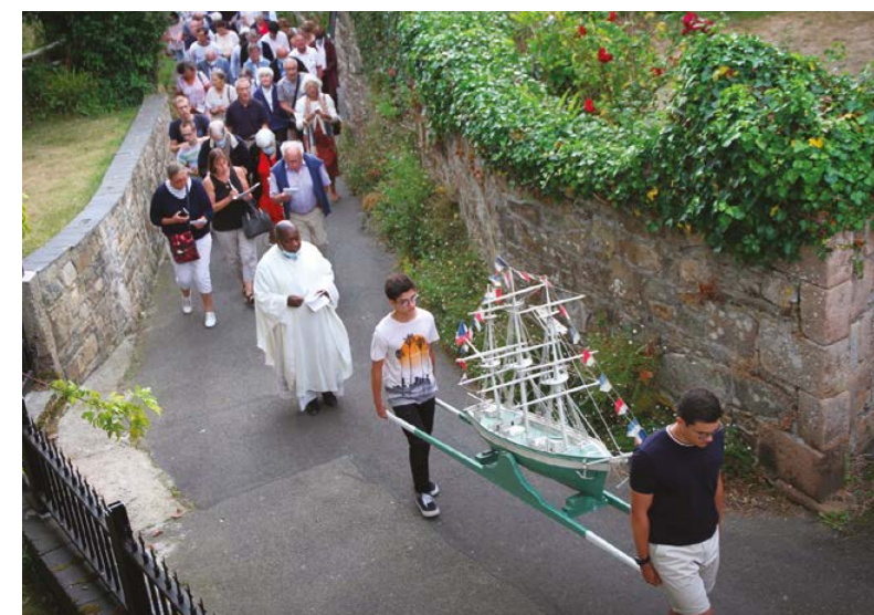
Pardon de Saint-Quay

On peut noter l'heureuse et volontaire coïncidence que le pardon de Saint-Quay, fête religieuse, a eu lieu le même soir que le fest-noz et le feu d'artifice, fête profane. Jusqu'aux années 1950/60 les pardons bretons étaient en général suivis l'après-midi d'une fête profane avec auto-tampons, de nombreux stands et parfois même d'une course cycliste. Tout le village s'y retrouvait pour se rencontrer et s'amuser.