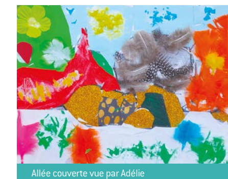
Allée couverte vue par Adélie