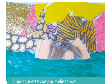
Allée couverte vue par Mélissande