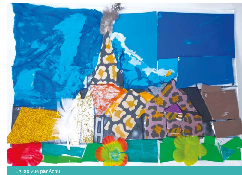
Église vue par Azou

➔ Les travaux des 8 petits artistes, qui ont revisité le patrimoine de Saint-Quay, ont été exposés à la bibliothèque pendant quelques jours, avant d'être rendus à leurs auteurs !