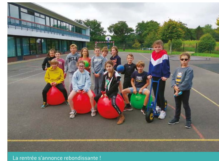
La rentrée s'annonce rebondissante !

Motivés, les élèves se sont tout de suite remis au travail.