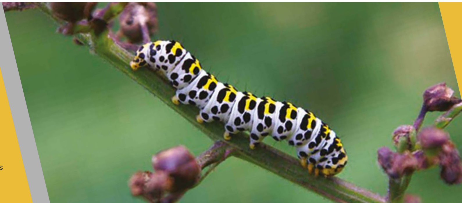
Le papillon Machaon