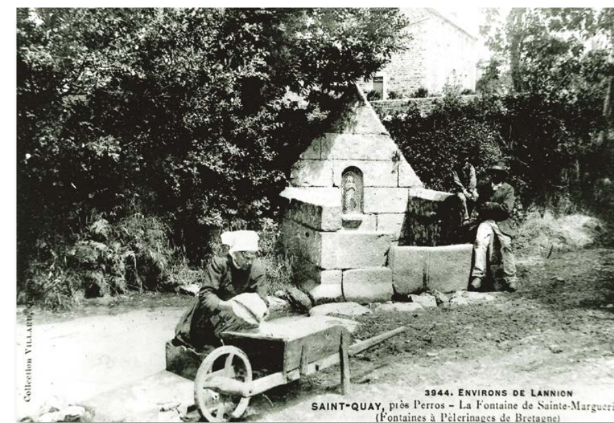
3944. ENVIRONS DE LANNION SAINT-QUAY, près Perros - La Fontaine de Sainte-Marguerite (Fontaines à Pèlerinages de Bretagne)

Ces événements consacrent le travail de trois années d'engagement et de partage.