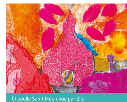
Chapelle Saint-Méen vue par Ella