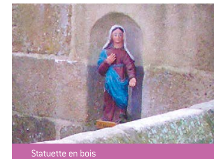
Statuette en bois