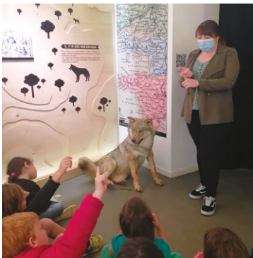
Les GS, CP et CE écoutant les légendes du loup-garou et de la bête du Gévaudan, racontées par la guide du musée du Loup, devant un loup empaillé, le 13 juin.