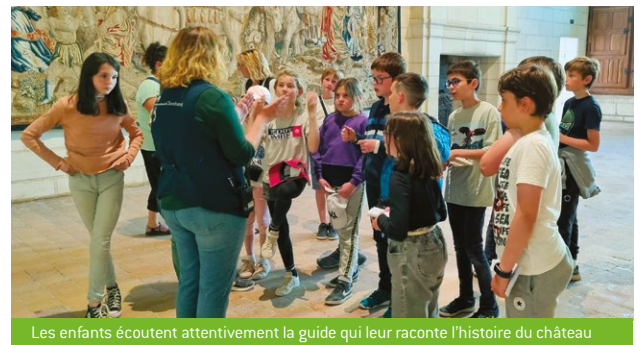
Les enfants écoutent attentivement la guide qui leur raconte l'histoire du château

Lors de cette visite, les élèves de Saint-Quay-Perros ont pu voir "en vrai" les maquettes et machines de Léonard de Vinci, si présentes dans les livres d'histoire. Ils ont également participé à un atelier de dessin :