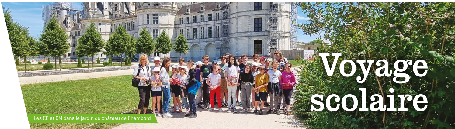
Les CE et CM dans le jardin du château de Chambord

lettre d'information municipale de Saint-Quay-Perros