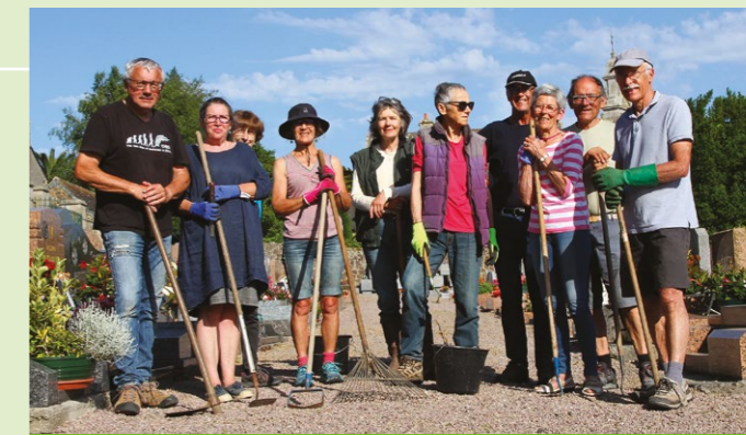
Nettoyage du cimetière par des bénévoles permettant entre-autres de ne pas utiliser de produits phytosanitaires

La charte "Entretien des espaces des collectivités" accompagne les collectivités pour se passer de produits phytosanitaires dans leur gestion des espaces publics. La région Bretagne, ambitieuse sur ce sujet, est encore plus exigeante. Elle propose un niveau supérieur auquel la commune de Saint-Quay-Perros adhère depuis la nouvelle mandature. Les élus ont à cœur avec les services techniques communaux d'obtenir ce label qui valorise l'absence totale d'utilisation de produits phytosanitaires sur les espaces publics (stade et cimetières compris). Ils ont ainsi reçu ce prix remis par la région, à Rennes jeudi 30 juin.