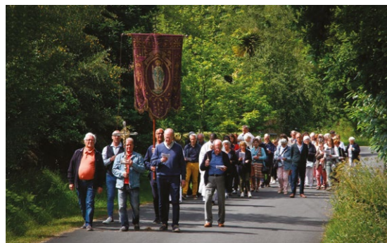
Messe, pardon et verre de l'amitié organisés par les amis de la chapelle Saint-Méen, ce lundi de Pentecôte.