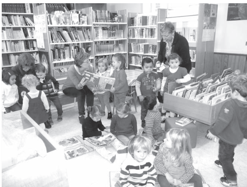
« Moment lecture » des enfants de petite section à la bibliothèque.